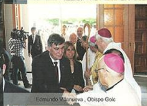
Edmundo Wlanueva, Obispo Goic