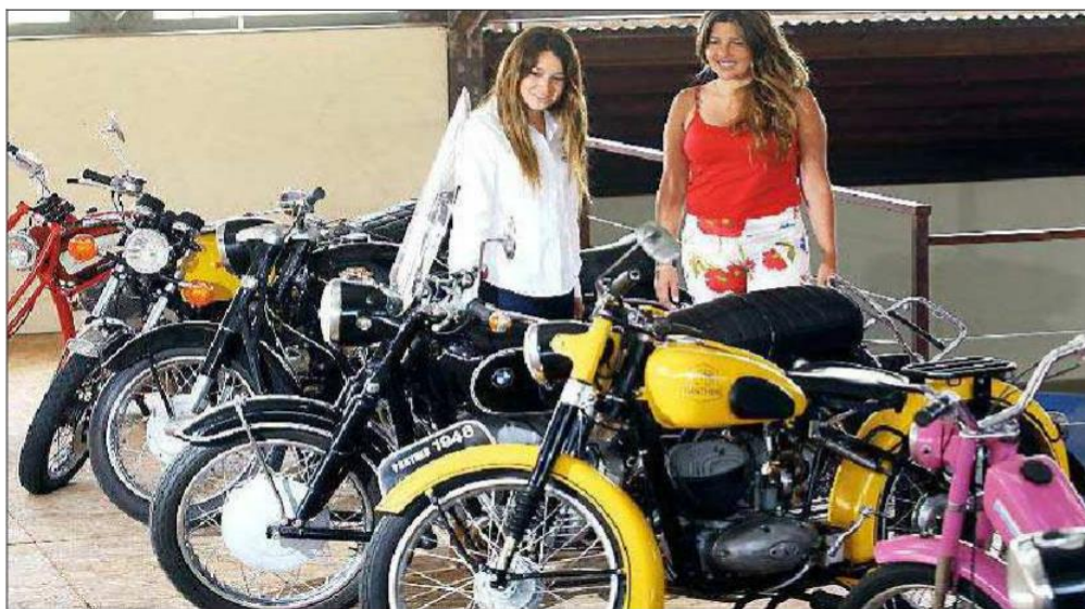
PRESENTACIÓN. — Los turistas que llegan al Museo del Automóvil en la Viña Santa Cruz, en Lolol, ya pueden admirar las particulares piezas de la muestra de motocicletas. La inauguración oficial será en el mes de abril.

Muestra la impulsa el empresario Carlos Cardoen, en Museo del Automóvil, y espera recibir 15 mil visitantes al año. Gran parte de la colección pertenece al humorista “Coco” Legrand.