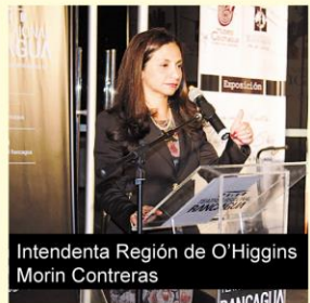
Intendente Región de O'Higgins Morin Contreras