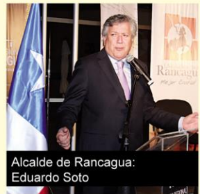
Alcalde de Rancagua: Eduardo Soto