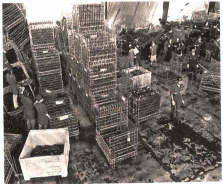
En Viña Sutil , las bodegas quedaron con millonarios daños.