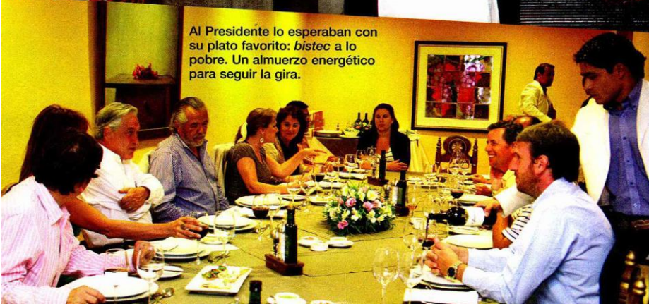
Al Presidente lo esperaban con su plato favorito: bistec a lo pobre. Un almuerzo energético para seguir la gira.