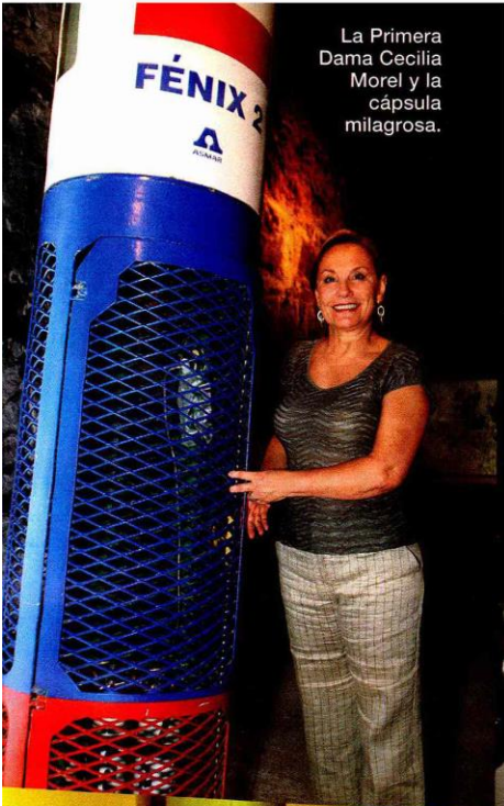
La Primera Dama Cecilia Morel y la cápsula milagrosa.