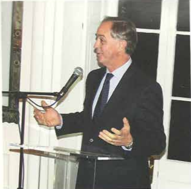
Alcalde de Las Condes, Francisco de la Maza